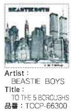
Artist: BEASTIE BOYS Title: TO THE 5 BOROUGHS 品番: TOCP-66300

今年も9・11がやってくる・・・今回はその現場となったN・Yを拠点にがんばるオヤジ3人組の最新作のご紹介です。ピースティ・ボーイズと名乗る彼らは81年にN・Yにて結成。当初はハードコアバンドでしたが、すぐさまHIPHOP路線へと変更。彼らが他のHIPHOPの連中と一線を画してる点はやはり彼ら3MCが楽器を持てば軽くJAZZなんかやっちゃうぐらいの懐の広さを持つてる点なんです!この最新作ではテロ後のニューヨーカー(彼ら)のタフさ、40歳になってもあいつも変わらんオタク度満点のライムにMMM/DJのギョングン・スクラッチ!もうめたくそストレートやし、かっこええ(筆舌に尽くし難い)の一言ですわ!彼ら聴かずしてHIPHOP語る事なかれ・・・チエケ、チエケ、チエケラッチョ!!(ruffles 加美東)